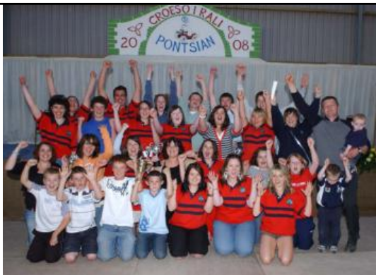
MYDROILYN YN FUDDUGOL!

O amgylch y byd – Caerweddros Arddangosfa Ffederasiwn – Llanwenog Gosod blodau – Penparc Coginio – Llanddeiniol Crefft – Llangwyrfon Cystadlaethau’r Aelodau – Llanddeiniol Tirnod Enwog – Caerweddros Coedwigaeth – Llanddeiniol Barnu moch – Talybont