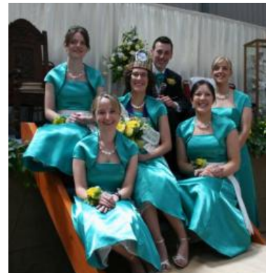
Ond dyw John yn foi lwcus!!!

O amgylch y byd – Caerweddros Arddangosfa Ffederasiwn – Llanwenog Gosod blodau – Penparc Coginio – Llanddeiniol Crefft – Llangwyrfon Cystadlaethau’r Aelodau – Llanddeiniol Tirnod Enwog – Caerweddros Coedwigaeth – Llanddeiniol Barnu moch – Talybont