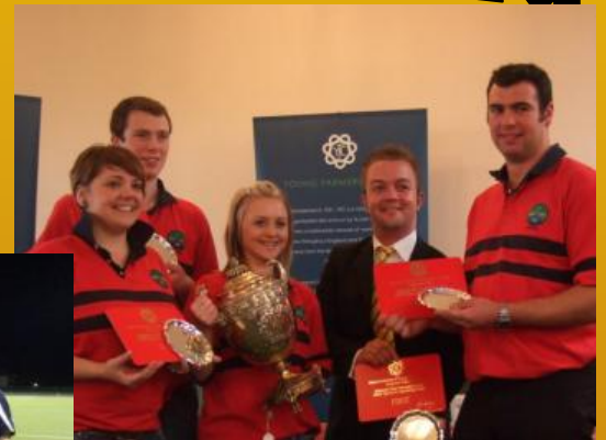
Clwb Mydroilyn yn ennill Hyrwyddo Clwb dros Gymru a Lloegr.